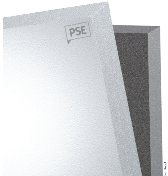
Panneau Knauf Therm et panneau Knauf XTherm.

La première clé d'entrée de la gamme Knauf Therm et Knauf XTherm pour l'isolation de dalle béton constitue la nature de la dalle : s'agit-il d'une dalle portée ou non ? Dans le cas des dalles portées, les panneaux de PSE placés dans la réservation entre le fond de forme et la sous-couche de la dalle assurent parfaitement le rôle de coffrage isolant thermique. Dans cette configuration, la principale problématique du chantier constitue la profondeur de la réservation au regard des exigences d'isolation thermique. Knauf, grâce à son expertise, propose donc deux réponses spécifiques : le panneau Knauf Therm Dalle Portée Rc50 de lambda de 0,038 W/(m.K) (ancien Knauf Therm Dalle Portée Th38) répond ainsi à la grande majorité des chantiers d'isolation de dalle portée standards, avec d'excellentes performances mécaniques. Son nouveau nom met en avant sa résistance à la compression à la limite élastique (Rc = 50 kPa). Et pour les cas de profondeurs de réservation figées combinés avec des exigences d'isolation thermiques élevées, Knauf préconise son tout nouveau panneau, le Knauf XTherm Dalle Portée Rc30 .